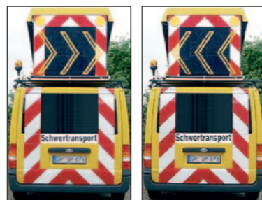
Die sich aufbauenden Pfeile in der Hecktafel und die komplette Fronttafel sind nur für den Einsatz im europäischen Ausland zugelassen.

Die Ausrüstung der Fahrzeuge richtet sich nach der RGST 1992 (Richtlinie für Großraum- & Schwertransporte). Der wichtigste Bestandteil ist eine Wechselverkehrszeichen-Anlage zum rückwärtigen Abstrahlen der StVO-Zeichen